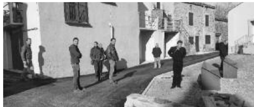
Rue de Camplong.