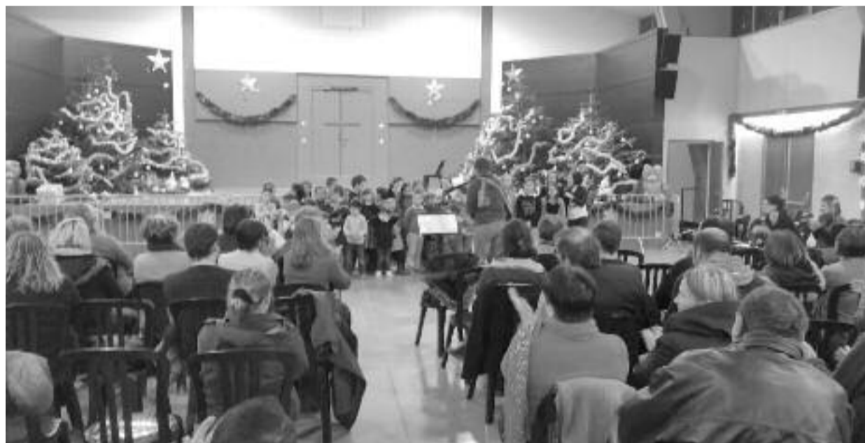
Noël à l'école.