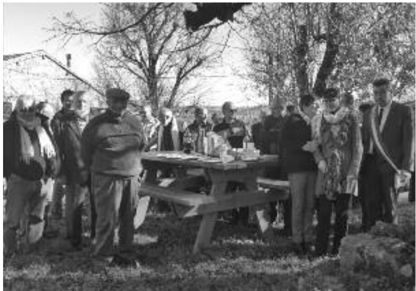
Cérémonie du 11 novembre.