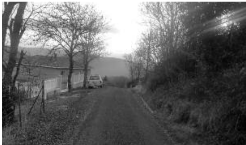
Rue des Rouquettes.