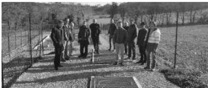
La station d'épuration.