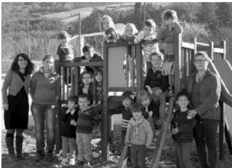
Classes maternelle et CP Fondamente.