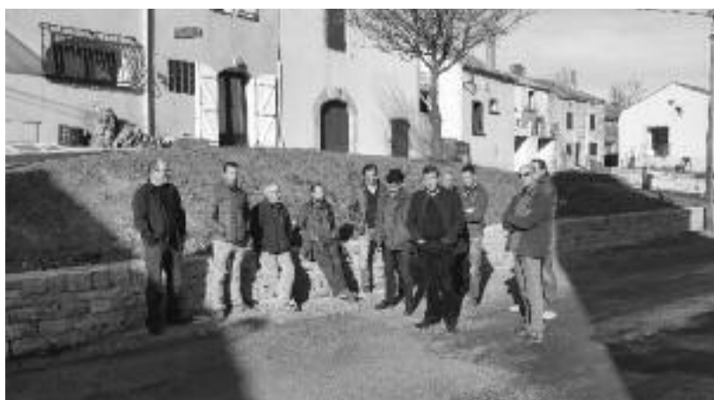
Place du village.