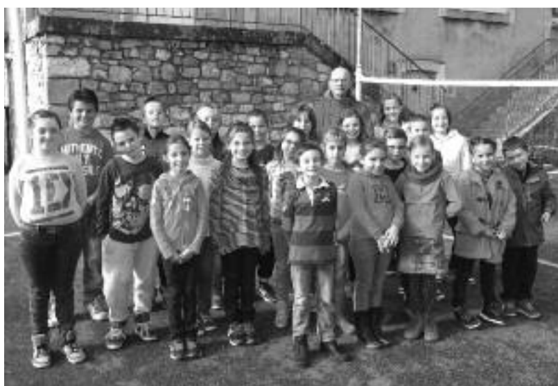
Classes de CE et CM Cornus.